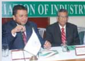
Meeting with SITE Association 05