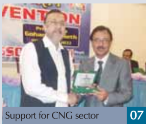
Support for CNG sector 07