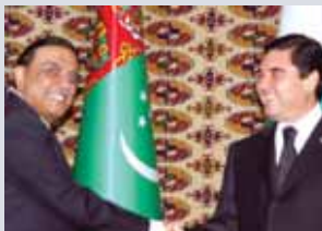
TAPI: Gas agreement signed 04