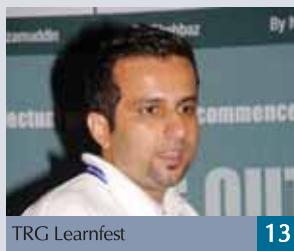
TRG Learnfest 13