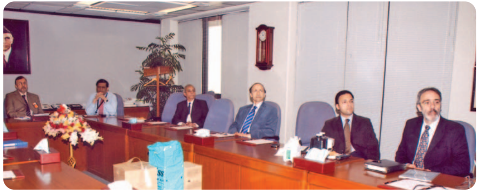
DMD (O & P) and team listening to the Itron presentation