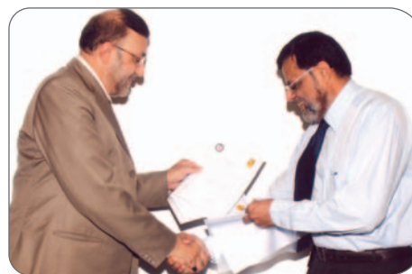
Senior managers distributing certificates to the participants on the conclusion of the training