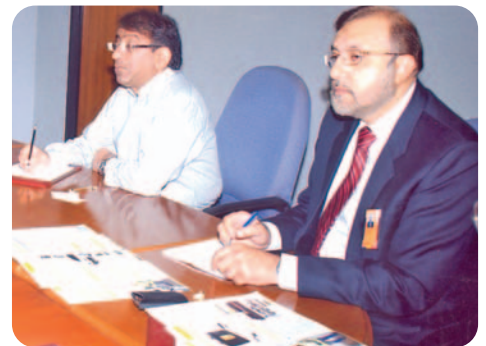
MD, SSGC flanked by DMD (O & P)