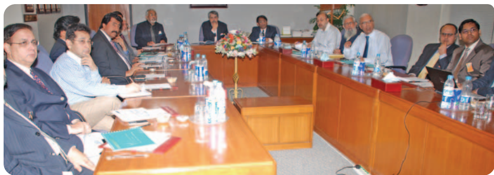
Federal Minister for Petroleum listening to the presentations

SSGC has devised a quantifiable strategy for reducing Unaccounted for Gas (UFG) or line losses within the next three years to a satisfactory level. Through a yearly reduction plan, the Company intends to rehabilitate its distribution lines, install new automatic pressure management systems as well as smart meters and carry out massive leak rectification and theft control.