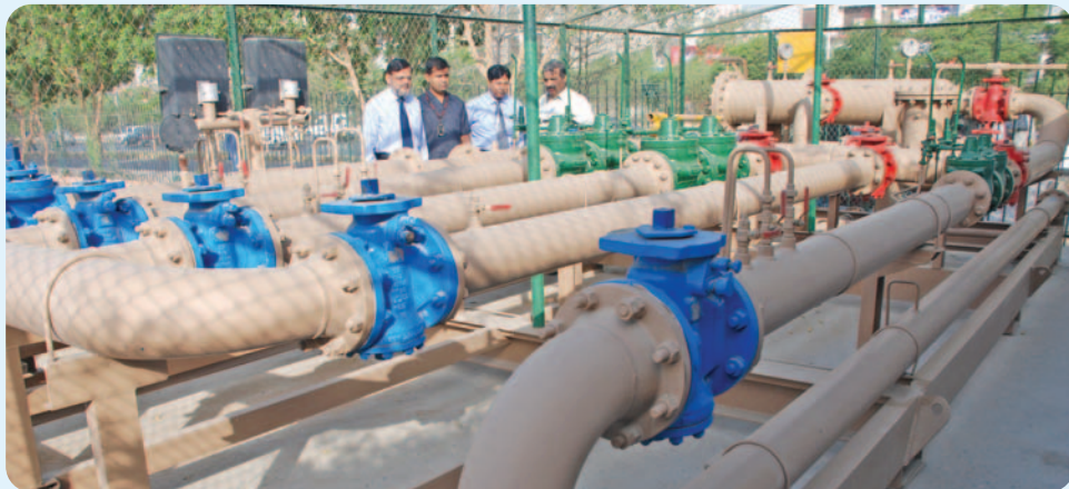
Distribution and SCADA executives inspecting the installation

The Karachi Distribution Department in coordination of SCADA has successfully constructed and installed an Automatic Pressure Management System at Expo Centre Town Border Station (TBS) near the SSGC Head Office. The system is operating successfully.