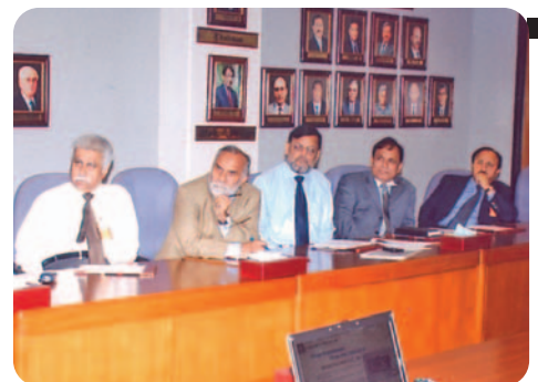
A view of senior managers at the presentation