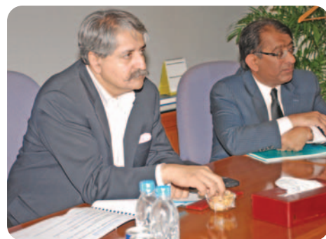
Minister flanked by MD, SSGC