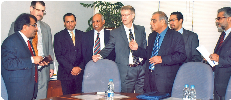
MD, SSGC exchanging cards with World Bank officials

the rehabilitation, to check the reduction in gas losses. During the meeting, the need to improve Cathodic Protection (CP) on the distribution network was also discussed in order to arrest the further