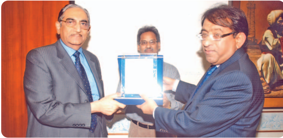
MD, SSGC presenting a memento to Dr. Samar Mubarakmand