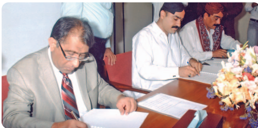
MD, SSGC and CBA office-bearers signing on the Charter; Minister addressing the audience