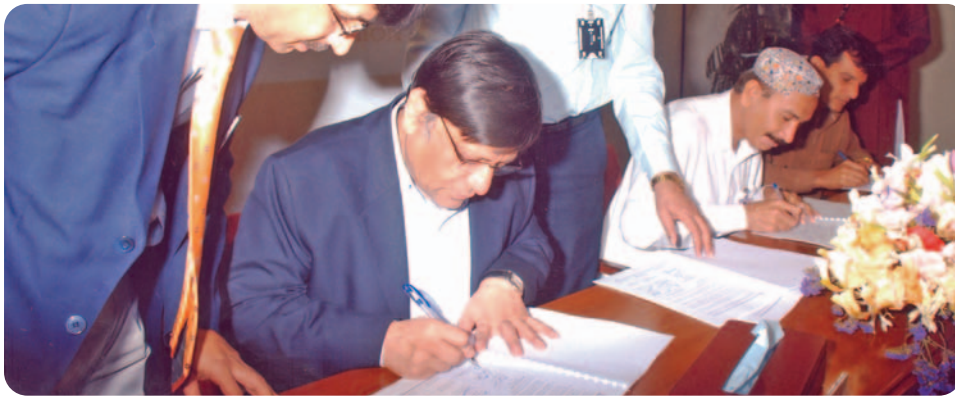
SGM (MS) signing on the Charter

He thanked the management of SSGC for reinstating some three thousand jobless employees through the Presidential Ordinance for the Restoration of the Employees.