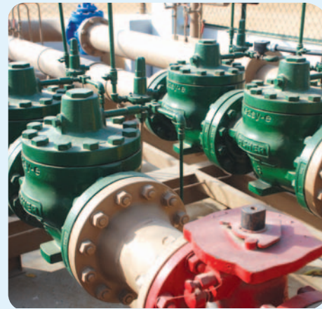
A view of the TBS

During off-peak hours, the sensing of low pressure set regulator is opened; therefore it starts working in the regulated run operating at lower pressure. By setting in the timer, multiple commands can be given to operate regulated run at lower or higher pressure for as many times as it requires during day and night to maintain optimum pressure in the system.